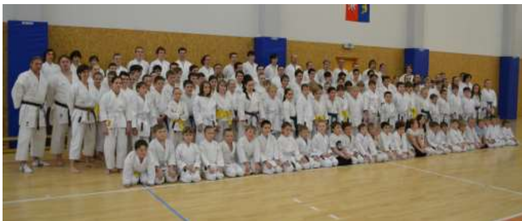
SK Karate Spartak Hradec Králové – březen 2014 (část členské základny)